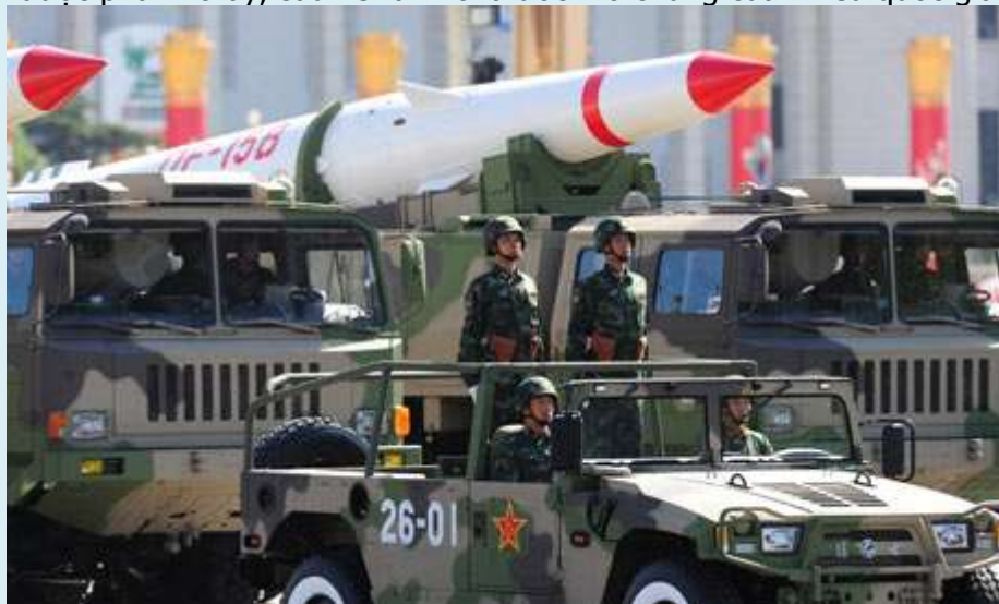
Lực lượng Trois Bateaux "khoe của"

Nước Đại Hán cần được phanh thây, sâu xé ra nhỏ là ước mơ chung của nhiều quốc gia.