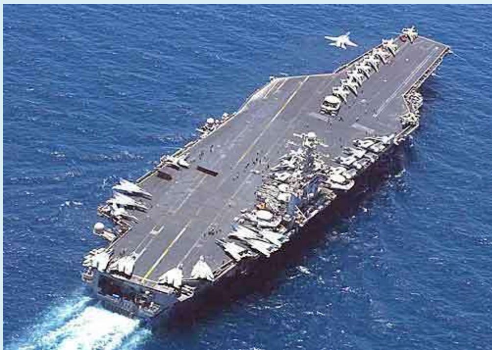
USS George Washington

VIT - Bản tin của mạng zaobao.com (Singapore) phát đi lúc 9h15 sáng (8h15 giờ Hà Nội) ngày 11 tháng 7 cho biết hôm thứ Sáu 9/7, hàng không mẫu hạm năng lượng hạt nhân "George Washington" của Mỹ đã rời căn cứ ở Nhật lên đường tới Hoàng Hải để tham dự cuộc tập trận chung Hàn Quốc-Mỹ. Tờ báo viết: sự việc này sẽ "chạm thần kinh" Trung Quốc.