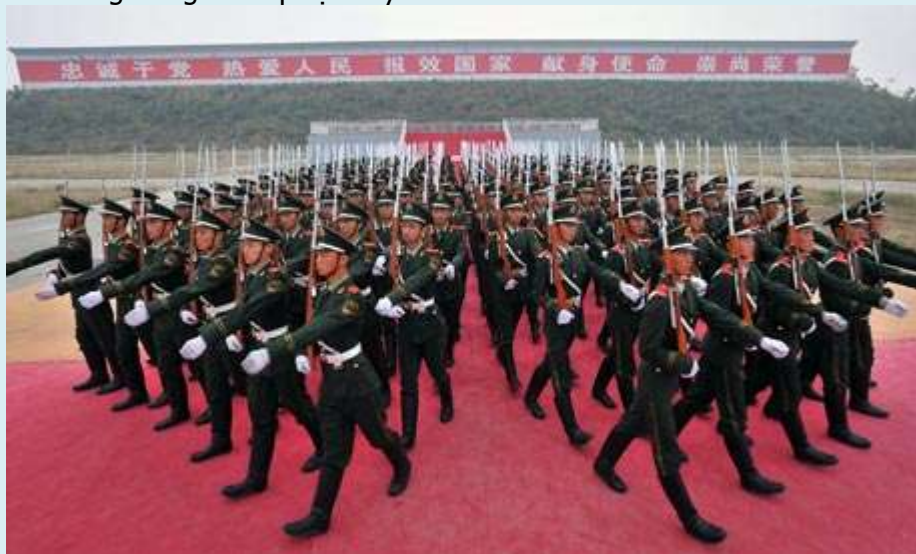
BỘ ĐỘI Trois Bateaux giương oai thị uy

Những năm gần đây mấy anh Ba Tàu (Trois Bateaux) giương oai thị uy hiếp đáp các xứ láng bang. Khi Trois Bateaux có dân số đông như kiến, có đô la xanh dư thừa, có kỹ thuật cao thì mỗi họa nguy cơ Đại Hán bá quyền bành trướng đang và tiếp tục xảy ra.