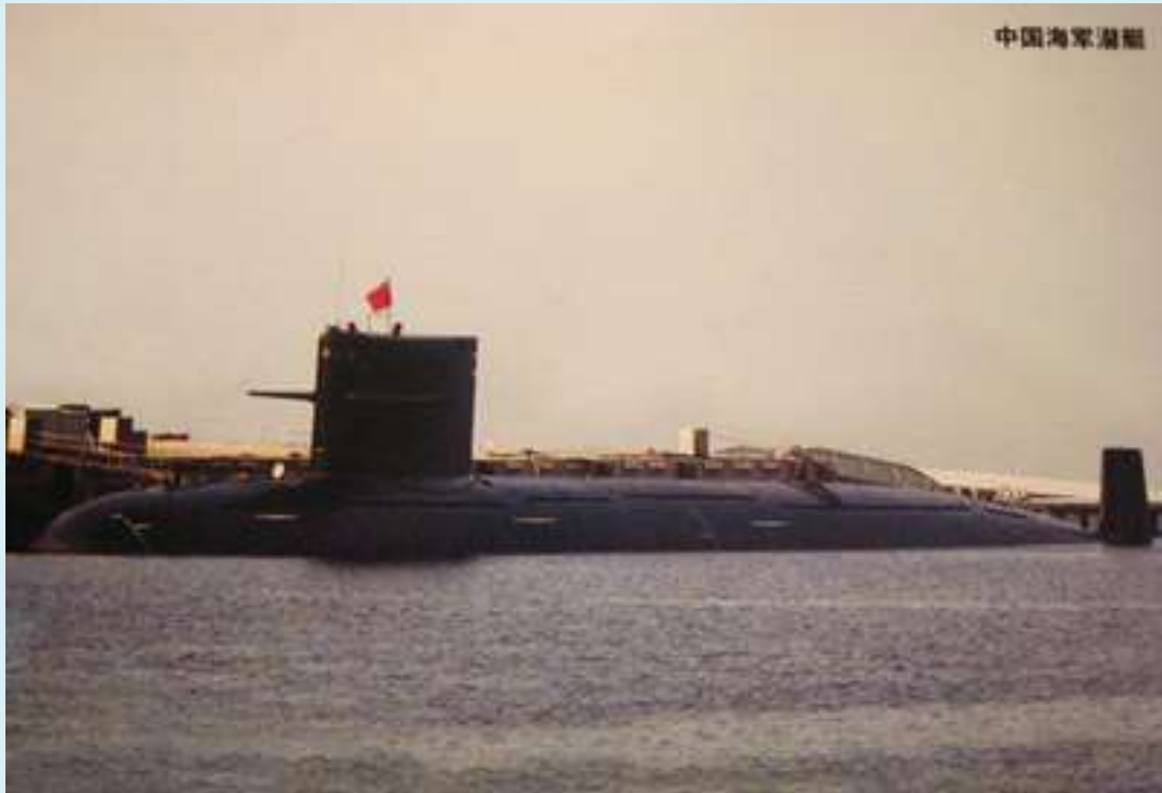
Tàu ngầm nguyên tử lớp Trois Bateaux

VIT - Bản tin của mạng zaobao.com (Singapore) phát đi lúc 9h15 sáng (8h15 giờ Hà Nội) ngày 11 tháng 7 cho biết hôm thứ Sáu 9/7, hàng không mẫu hạm năng lượng hạt nhân "George Washington" của Mỹ đã rời căn cứ ở Nhật lên đường tới Hoàng Hải để tham dự cuộc tập trận chung Hàn Quốc-Mỹ. Tờ báo viết: sự việc này sẽ "chạm thần kinh" Trung Quốc.