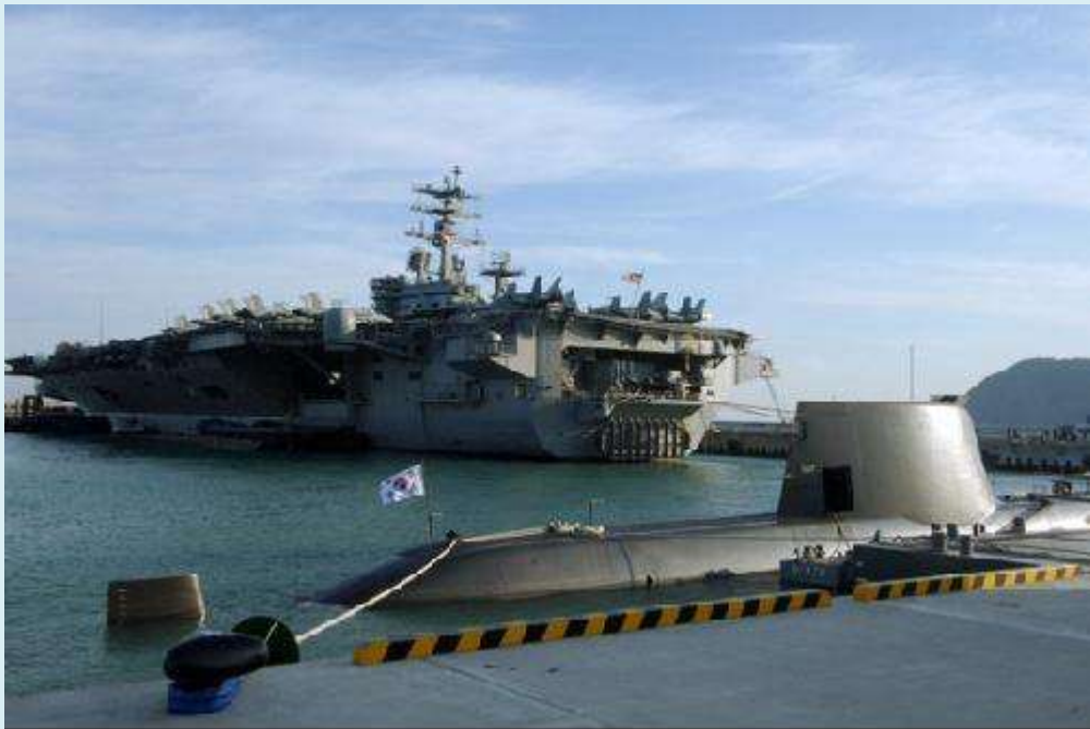
Mỹ Hàn tập trận chung tại Hoàng Hải

xâm lược Trung Quốc, vì vậy người Trung Quốc coi Hoàng Hải là một địa điểm rất nhạy cảm dính đến quá khứ bắt nạt và xâm lược Trung Quốc.