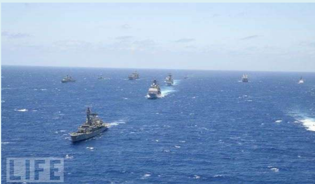
Rimpac exercise - Operations Hawaii

Phạm vi hoạt động của máy bay trên tàu vào khoảng 700-1000 km, như vậy Mỹ vào Hoàng Hải thì bao nhiêu bí mật quân sự của Trung Quốc tại vùng cửa ngõ chiến lược này sẽ bị Mỹ khám phá hết. Mỹ đang muốn tìm hiểu về Hoàng Hải, cuộc tập trận này với danh nghĩa là diễu võ dương oai với Triều Tiên sau vụ tàu Cheonan của Hàn Quốc bị ngư lôi Triều Tiên bắn chìm, là cơ hội trời cho để Mỹ có cơ vào Hoàng Hải. Năm 1994 tàu sân bay Mỹ Kitty Hawk từng vào đây một lần và máy bay Mỹ có chạm trán với máy bay Trung Quốc.