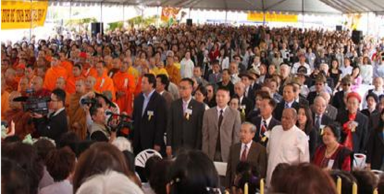
Trên 5000 Phật tử tham dự Đại lễ Phật Đản tại chùa Điều Ngự, ghế sắp không đủ ở hội trường, đồng bào phải đứng tràn khắp quanh sân chùa

«Trên 2000 năm qua, Giáo Hội Phật Giáo Việt Nam Thống Nhất, hiện đặt dưới sự lãnh đạo của Đại lão Hòa thượng Thích Quảng Độ - Xử lý Viện Tăng Thống kiêm Viện Trưởng Viện Hóa Đạo, đã vun trồng hạt giống từ bi, cảm thông, hài hòa và bao dung trong xã hội bằng cách tuyên dương nền hòa bình qua sự thực hành các nguyên lý căn bản của Phật giáo và không ngừng tranh đấu cho quyền làm người đặc biệt là Quyền tự do tôn giáo tại Việt Nam ».