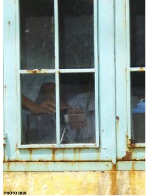
PHOTO 1818 Công an quay phim lên chùa Giác Minh suốt ngày lễ Phật Đản

Đồng thời với việc loan báo hôm nay, Phòng Thông tin Phật giáo Quốc tế đã thiết lập hồ sơ đàn áp Phật Đản gửi đến Hội đồng Nhân quyền LHQ ở Genève và chính giới Âu, Mỹ, Á.