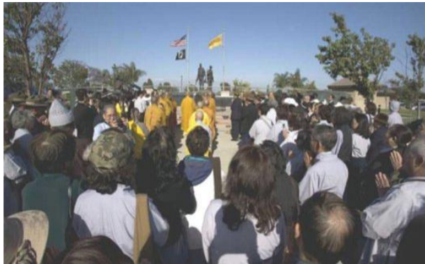
Một ngày trước lễ Phật Đản, Chư Tăng, Phật tử đến viếng và Cầu siêu trước Tượng đài Chiến sĩ Việt Mỹ

Một khóa tu học Phật pháp cũng được tổ chức ba ngày trước đó với trên 300 học viên từ khắp các tiểu bang Hoa Kỳ về tham dự. Trong số này có 200 học viên phát nguyện thọ Bồ tát giới vào sáng ngày Khánh Đản.