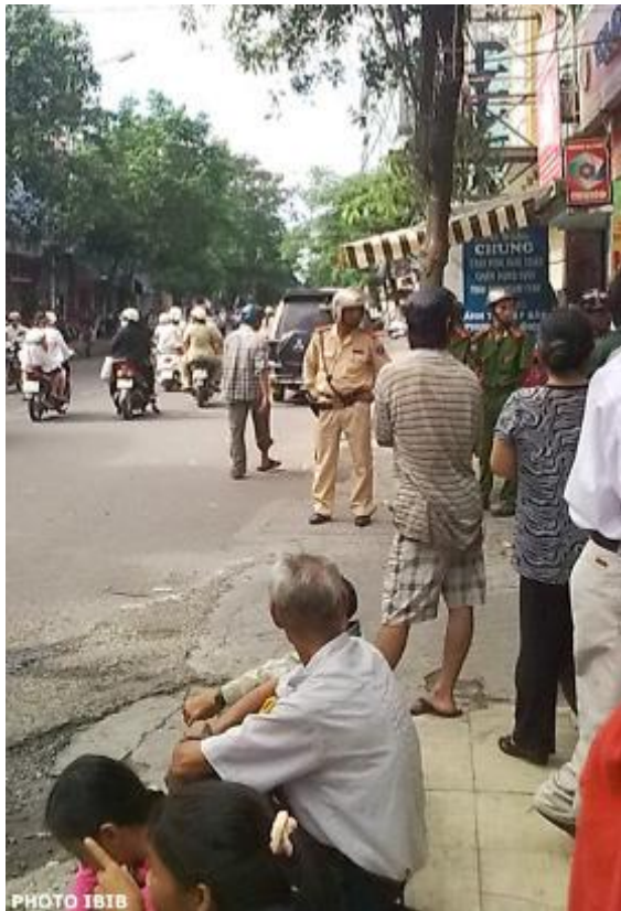
Công an đứng trước đường hẻm vào chùa Giác Minh ngăn cấm mọi Phật tử vào tham dự Đại lễ Phật Đản